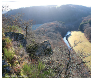
Natur pur