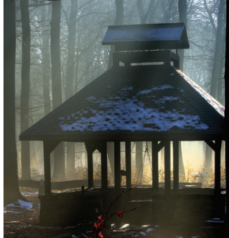
Sälgäz © Théo Jean-Pierre